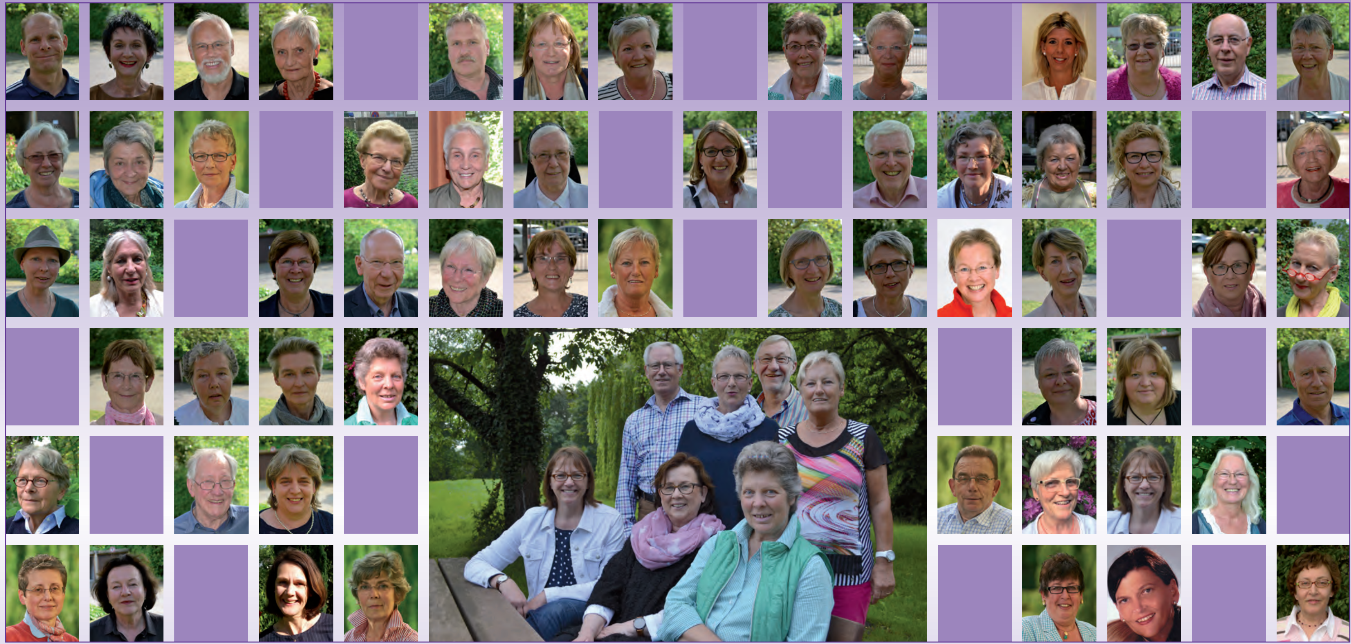
Hospizbegleiter/innen Vereinsvorstand Hospizbegleiter/innen