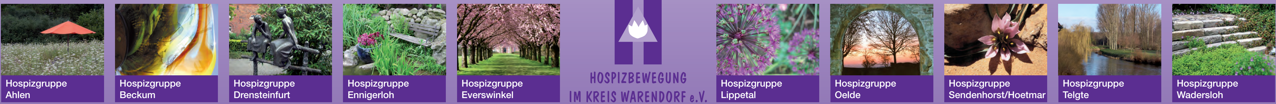
Hospizgruppe Ahlen Hospizgruppe Beckum Hospizgruppe Drensteinfurt Hospizgruppe Ennigerloh Hospizgruppe Everswinkel HOSPIZBEWEGUNG IM KREIS WARENDORF e.V. Hospizgruppe Lippetal Hospizgruppe Oelde Hospizgruppe Sendenhorst/Hoetmar Hospizgruppe Telgte Hospizgruppe Wadersloh