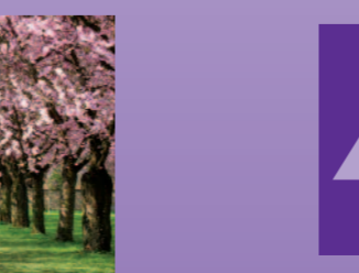
HOSPIZBEWEGUNG IM KREIS WARENDORF e.V.